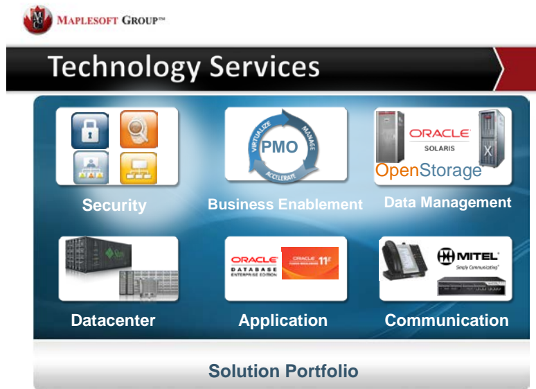
Figure 2 Portefeuille des services de Maplesoft